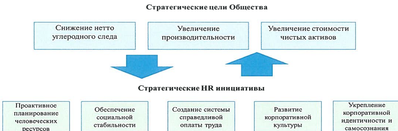
Рисунок 1. Стратегические HR инициативы

4.3. Персонал Компании является основным активом и его конкурентным преимуществом. Масштаб и сложность изменений в рамках реализации Стратегии развития, а также конкурентная внешняя среда требуют приобретения работниками новых навыков, а также изменения ценностных установок и корпоративной культуры. Все направления работы с персоналом потребуют существенной модернизации, развития и применения лучших практик управления, что будет достигнуто через смещение роли HR функции с административно-поддерживающей роли до стратегического партнера бизнес-подразделений Компании.